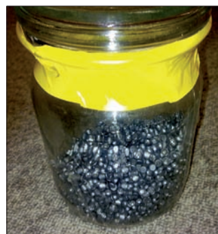
Schwer zu schätzen, wie viele Diabolos sich in diesem großen Glasbehälter befanden.

Als im vergangenen Jahr das 50. Vereinsjubiläum anstand, war die Jugendgruppe mit einer Aktion zur Stelle, die bestens zur nötigen Konzentration und Präzision beim