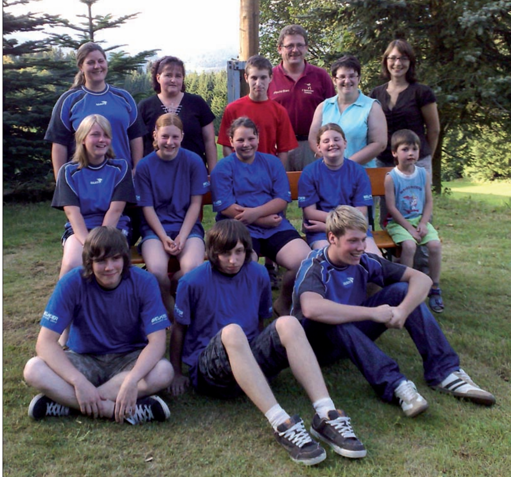
Die Jugend der Bergschützen Schwaben dürfen sich zurecht über ihre gelungenen Aktion freuen.