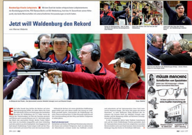
26 Jetzt will Waldenburg den Rekord Bundesliga-Finale Luftpistole