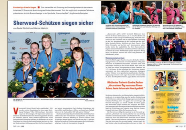
50 Sherwood-Schützen siegen sicher Bundesliga-Finale Bogen