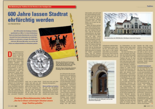
38 600 Jahre lassen Stadtrat ehrfürchtig werden Die Bedeutung der Tradition für die Vereine