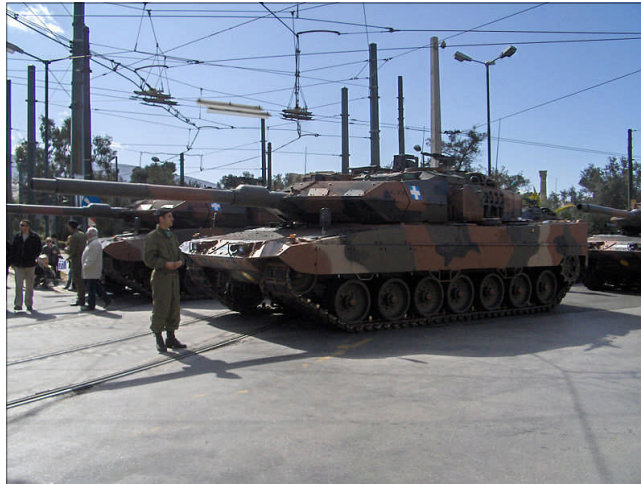
Made in Germany: ein Leopard 2-Panzer der griechischen Armee. Das Gesamtvolumen alleine dieses Rüstungsauftrages betrug laut Presseberichten 1,7 Milliarden Euro. Das Bild entstand anlässlich einer Truppenparade im März 2008 in Athen.

Das Stockholmer Friedensforschungsinstitut SIPRI