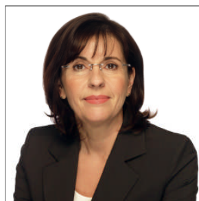
Andrea Ypsilanti: eine der bekanntesten PolitikerInnen und engagierte Gegnerin des Neoliberalismus

und „Macht“. Die Ergebnisse sind verheerend: Um sich greifende Armut vieler, Reichtumshäufung weniger, Ausdünnung öffentlicher Dienstleistungen, Bankenkrise, Bildungs- und die ungebremste Klimakrise. Immer mehr Menschen sehen ihre Lebenssicherheit bedroht. Die politischen Institutionen sind in einer Vertrauenskrise. Davon ist nicht zuletzt die SPD erfasst, obwohl es gegen-