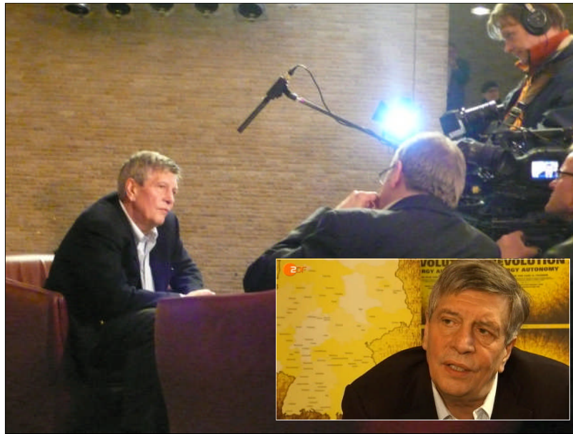
Hermann Scheer beim Interview mit dem ZDF bei der Berliner Premiere und später dann auf Sendung (kleines Bild)

Räume des Energieverbrauchs von den Räumen der Energiegewinnung stattgefunden hat. Energienutzung, Energie wird überall verbraucht, wo Menschen arbeiten und leben. Förderung von Erdöl, Erdgas, Kohle und Uran findet in ganz wenigen Ländern statt und wird immer knapper. Die Abhängigkeiten werden größer und sind existentieller Art. Dem setze ich das Ziel der Energieautonomie gegenüber: Es ist ein Wechsel von kommerzieller Primärenergie – Erdöl, Erdgas, Kohle, Uran – zu kostenloser Primärenergie: Sonnenstrahlen, Sonnenwärme, Wind, Laufwasserkraft, Wellen, geothermische Energie. Kostenlos von der Natur geliefert. Das heißt, die heutige Primärenergiewirtschaft wird verschwinden. Aber sie wird das nicht kampflos hinnehmen.“