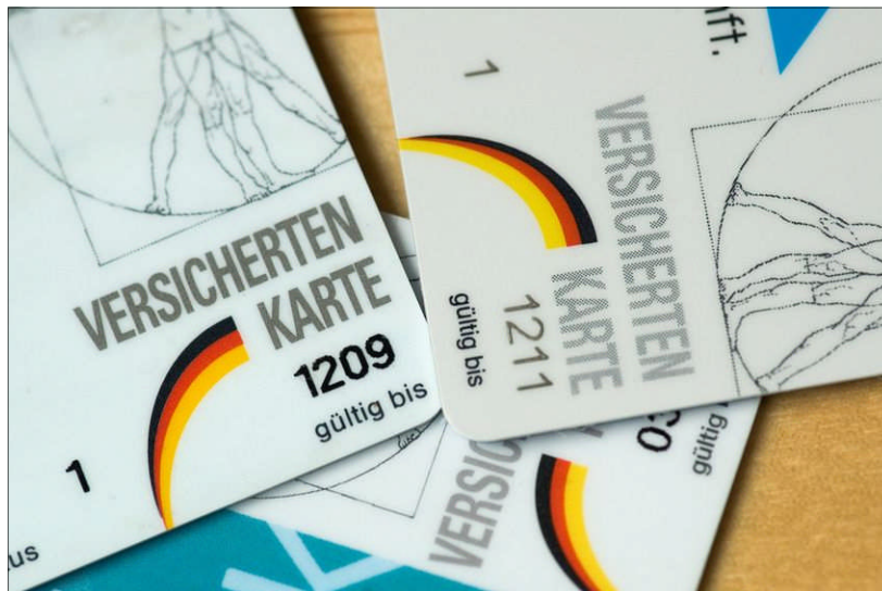
Die Krankenversicherung funktioniert nach dem solidarischen Prinzip. Mit der Kopfpauschale würde das ausgehöhlt.

Wenn das Gesundheitssystem also ein Gradmesser ist, dann ist Deutschland momentan dabei, sich zu entsolidarisieren. Die Pläne der Bundesregierung, eine Kopfpauschale im Gesundheitswesen einzuführen, führen geradewegs in diese Richtung. Das beginnt schon damit, dass alle Versicherten den gleichen Betrag bezahlen sollen, unabhängig vom Einkommen. Laut Berechnungen könnten das bis zu 200 Euro pro Monat sein (der Arbeitgeberanteil wird festgeschrieben). Das solidarische Prinzip, wonach Stärkere auch größere Lasten tragen können, während Schwächere entlastet werden, wird damit ausgehöhlt. Profitieren würden von der Kopfpauschale somit Gutverdiener, da ihr Versicherungsbeitrag unter dem läge, den sie im heutigen System bezahlen. Wie so etwas in der Praxis aussieht, kann man bereits jetzt an der „kleinen Kopf-