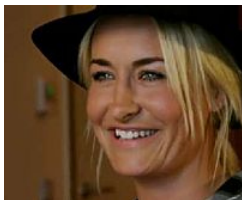
Sarah Connor und der peinliche Moment im Flugzeug