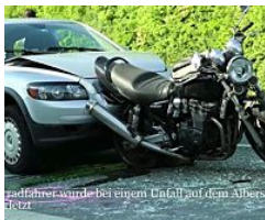
Unfall auf dem Albersloher Weg